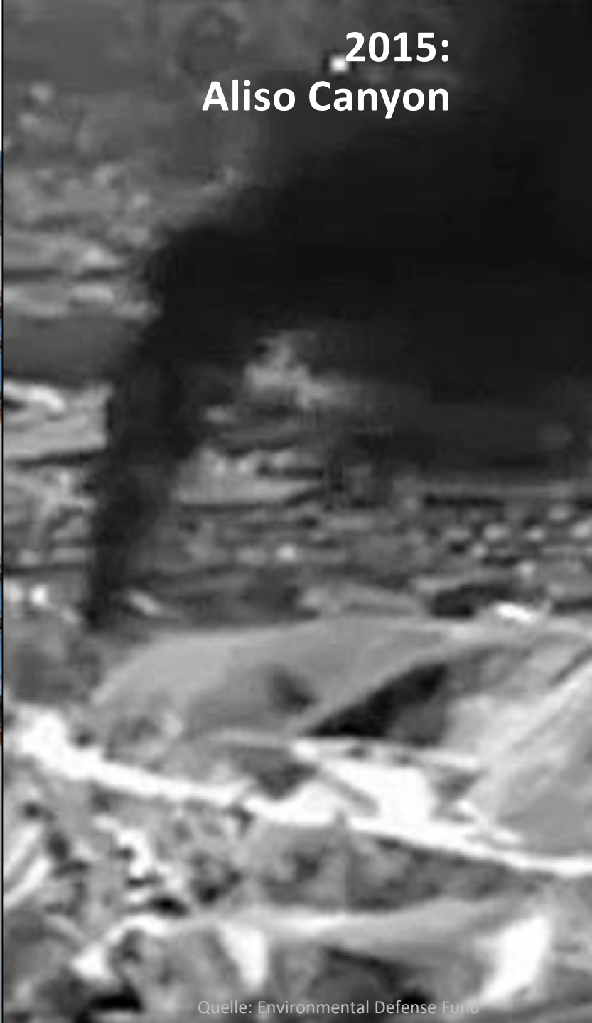
2015: Aliso Canyon